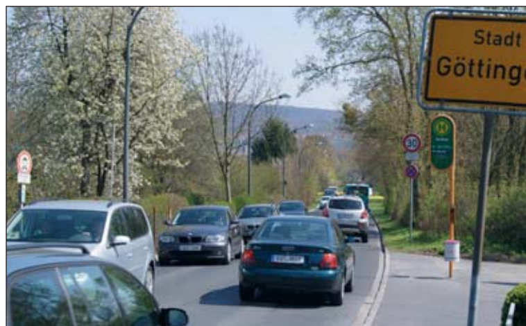
Die heimliche Südspange Sandweg führt mitten durch das Erholungsgebiet am Kiessee.

Wedrins: „Das ist eine Sache von wenigen Minuten.“ Der Umschlag muss auch nicht