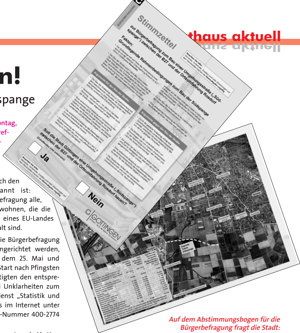
Auf dem Abstimmungsbogen für die Bürgerbefragung fragt die Stadt: „Soll die Stadt Göttingen eine Umgehungsstraße („Südspange“) zwischen der B27 und der Ortsumfahrung Rosdorf bauen?“

Mit der Auszählung der Stimmen kann erst nach Abstimmungsschluss begonnen werden. Mit dem Ergebnis ist deshalb nicht vor Mittwoch, 16. Juni 2010 zu rechnen.