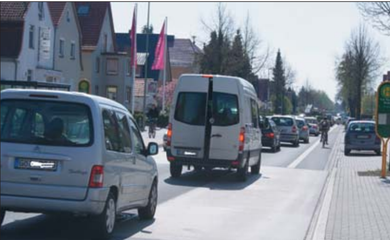
So weit das Auge reicht: Autoschlange auf der Reinhäuser Landstraße zur Hauptverkehrszeit.